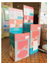
回収ボックス（盛岡市社協）