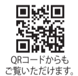
QRコードからもご覧いただけます。