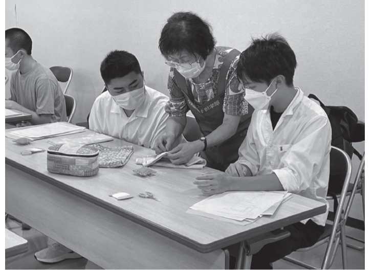
高校生ボランティアスクールの様子

また、誰もが地域社会で自立した生活を送れるよう、認知症高齢者や障がい者等の権利擁護や福祉サービスの利用支援を実施したほか、コロナ禍で減収や離職した方などの生活の安定を支援するため、総合支援資金や教育支援資金の相談などに当たり、行政機関や関係団体と連携し継続的な支援に取り組みました。