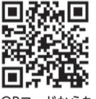
QRコードからもご覧いただけます。