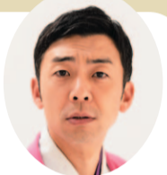
講師 天津木村 氏

1976年5月22日生まれ・兵庫県姫路市出身 吉本総合芸能学院 (NSC) 大阪校21期生 NSCの同期である向清太郎と1999年2月にコンビ「天津」を結成。 決め台詞「あると思います」は、2009年「新語・流行語大賞」にノミネート。 2021年4月 番組MC就任を期に岩手移住、いわて応援芸人襲名 2023年7月 もりおか魅力発信大使委嘱