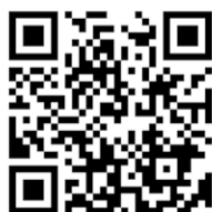
作成した動画は、こちらからご覧いただけます。