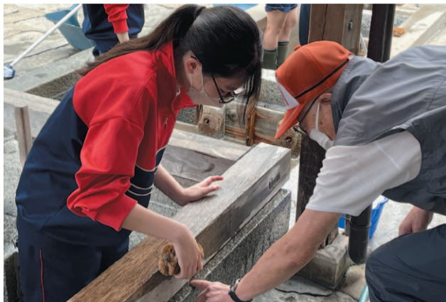
高校生ボランティアスクールの様子(大慈清水の清掃)