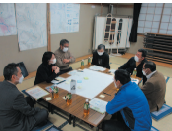
土淵地区福祉懇談会の様子

また、重層的支援体制整備事業や地域づくり事業を受託し、関係機関とのネットワーク体制を強化するとともに、要援護者の支援活動や地域活動支援に取り組みます。