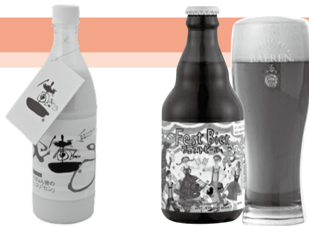
生マッコリ「セン」 (株)中原商店

また令和5年1月25日には、上記4企業と助成金を活用している2団体の方へ出席いただき、寄付金贈呈式を実施しました。寄付者である企業の方々とは助成金を活用する団体がお互いの取り組みを知り合う良い機会となりました。