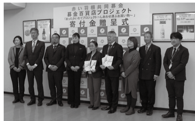
令和5年1月25日 募金百貨店プロジェクト寄付金贈呈式