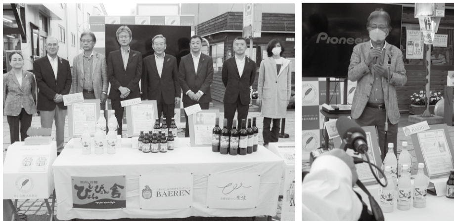
セレモニー当日の様子

令和4年10月1日、材木町「よ市」において、「令和4年度共同募金運動開始セレモニー」を岩手県共同募金会と共催で開催しました。セレモニーでは、PR動画の公開や寄付つき商品の紹介など、赤い羽根共同募金活動の周知をおこないました。