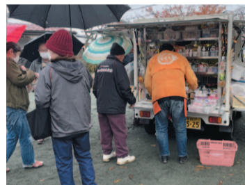
サロンdeお買い物の様子

また、住民交流の場となるサロン活動を支援し、サロンを活用した生活支援サービスとの連携を進めます。