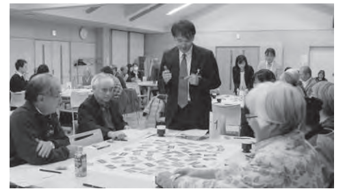
昨年の地区福祉懇談会の様子