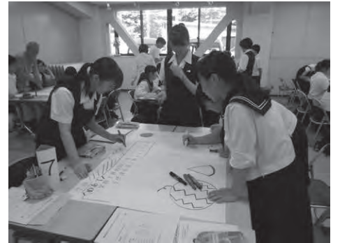
昨年の高校生ボランティアスクール

加えて、福祉課題を抱える世帯への個別支援や地域住民による支え合いの仕組みづくりなど関係機関や民生児童委員、地域との連携協力により支援活動をおこなうとともに、高齢者の生活支援体制の構築に向けた取り組みや、低所得者等への生活福祉資金の相談や資金貸付をおこない、県・市の関係行政機関、関係団体と連携し、支援ネットワークの一翼を担いました。