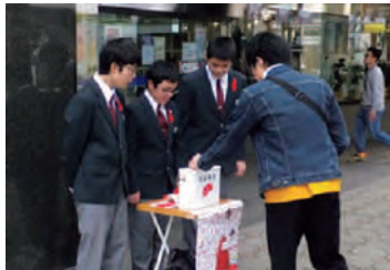
昨年の街頭募金の様子

赤い羽根共同募金は皆様のやさしい気持ちを集める活動です。盛岡を“人と人がつながり共に支え合うまち”にするため、今年も赤い羽根共同募金へのご協力をよろしくをお願いします。