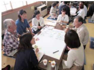
地区福祉懇談会の様子

また、関係機関とのネットワークの構築による要援護者に対する支援活動をおこなうとともに、生活支援体制整備事業による高齢者を地域で支える仕組みづくりを進めます。