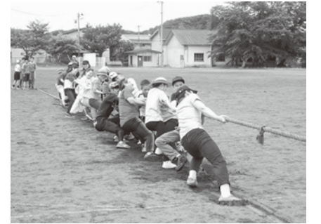
〈大運動会の様子(好摩)〉