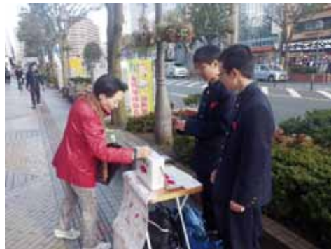
昨年の街頭募金活動の様子