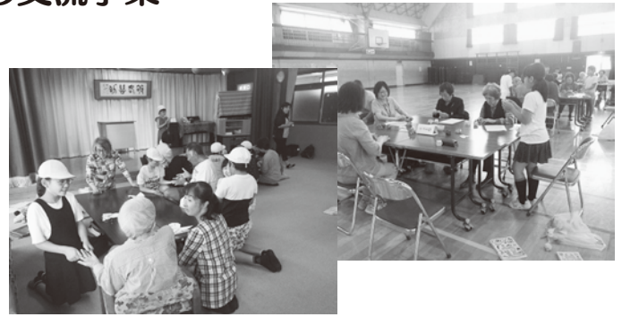
〈交流事業の様子(城南、加賀野)〉

参加した方々からは、「孫と同年代の子どもたちとこうして触れ合うことができて良かった」などの感想があり、城南小学校の生徒たちからは「地域の皆さんがとても楽しんでくれたので良かった」という感謝のことが述べられました。