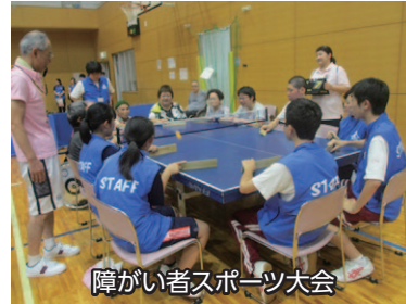
障がい者スポーツ大会