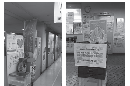
盛岡市役所(5F) 盛岡市社会福祉協議会 設置場所

本のご寄付は盛岡市役所、盛岡市社会福祉協議会、盛岡市社会福祉協議会玉山支所までお願いします。 ※寄付や回収に関しては、下記担当までお問い合わせください。