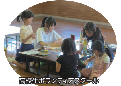
高校生ボランティアスクール

詳しくは → 盛岡市社会福祉協議会 地域福祉課 地域福祉係 TEL 651-1000