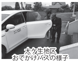
大ケ生地区 おでかけバスの様子

現在、大ケ生地域では、引き続き試験運行を実施しており、加賀野では、次の試験運行に向けて課題を整理中です。