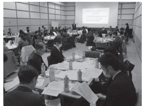
昨年の様子 東厨川地区・永井地区 (いずれも地域ケア会議との合同開催)