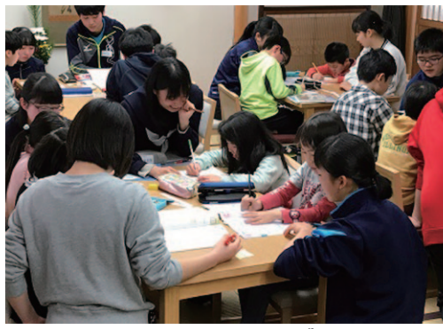
「侍屋宿題しよう会」事業での高校生ボランティアの様子