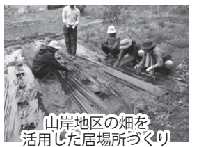
山岸地区の畑を活用した居場所づくり

どの地域の活動でも協力いただける方を募集中ですので、ご興味のある方は盛岡市社会福祉協議会までお問い合わせください。