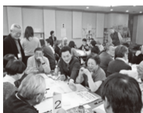
第3回杜陵地区 マンションサミットの様子