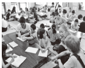
「レッツエンジョイ!!サマースクール inみたけ」の様子

この継続した講座の参加者の中からボランティアグループ「みたけのまちのボランティア」が誕生し、長期休暇となる際の子ども達への学習支援活動「レッツエンジョイ!!サマースクールinみたけ」を開催。冬休みには、夏休みと同様に「レッツエンジョイ!!ウィンタースクールinみたけ」を開催しました。