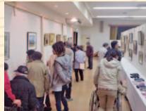
昨年度の老人作品展の様子

盛岡市在住で60歳以上の方々の絵画や手芸品、書道作品を集め、下記の3日間の日程で作品展を開催します。 日時：10月23日(火)～25日(木) 午前10時～午後5時 場所：盛岡市総合福祉センター 4F 講堂 (若園町2-2) 問い合わせ：盛岡市社会福祉協議会 地域福祉課 TEL 651-1000