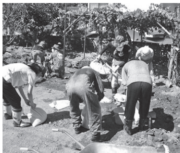
広島県広島市の様子②

この度の西日本を中心とする豪雨により、被災された皆様に心よりお見舞い申し上げます。