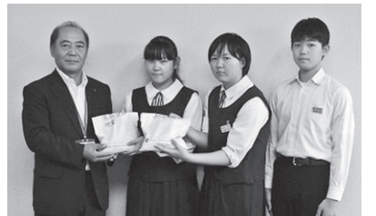
7月24日 盛岡市立厨川中学校様から義援金をお預かりしました

お預かりした義援金は中央共同募金会を通じて被災地へ届けられ、被災された方々のために役立てられます。