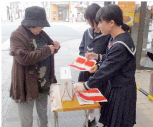
昨年の街頭募金活動の様子