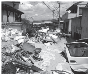
広島県広島市の様子①