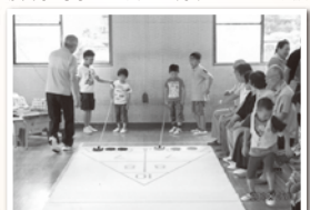
杜陵/ニュースポーツ