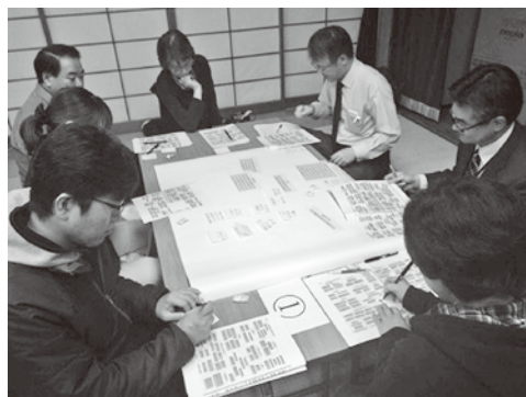
つなぎ地区の様子