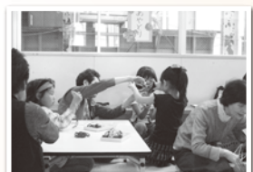
仙北/昔遊び(あやとり)