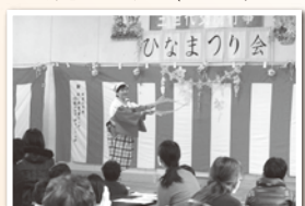
緑が丘/ひなまつり