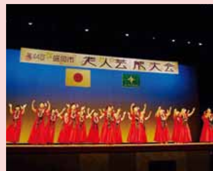
昨年度の大会の様子

日 時：2月10日(火) 正午から ※盛岡市老人クラブ大会終了後 場 所：岩手県民会館大ホール 内 容：踊り、合唱、フォークダンスなど 問い合わせ：盛岡市社会福祉協議会 地域福祉課 TEL 651-1000