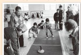
仁王/老人と子どもの交流会(ユニカール)