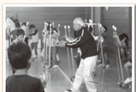
津志田/昔遊び(たけうま)