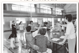
加賀野/小学生と一人暮らし高齢者のふれあい交流