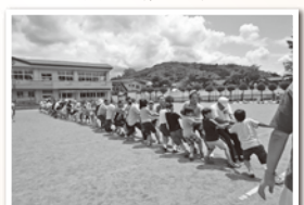
山岸/運動会(綱引き)