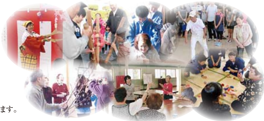
写真は各地の世代間交流事業から。詳しくは3面をご覧ください

年頭にあたり、謹んで新年のご挨拶を申し上げます。 市民の皆さまにおかれましては、お健やかに新年をお迎えのことと心からお慶び申し上げます。 日頃より本会の事業推進につきまして温かいご理解とご支援を賜り、厚く御礼申し上げます。