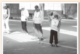
見前/世代間ゲートボール大会