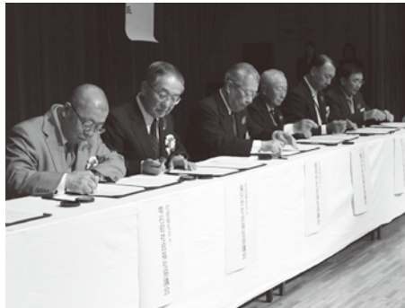
協定書に調印する各社協会長

このような経験から、今年2月から災害発生時における相互支援について協議し、盛岡広域管内で地震や大雨、洪水など住民生活に支障が生じた場合、災害状況などを迅速に把握し、応援職員の派遣や資機材の提供を行い、早期の復旧を図るため、協定を締結しました。