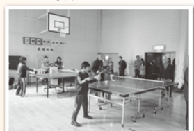
上田/三世代ふれあい卓球大会