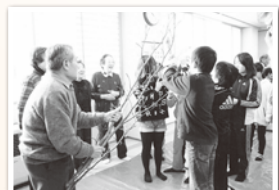
本宮/みずき団子づくり