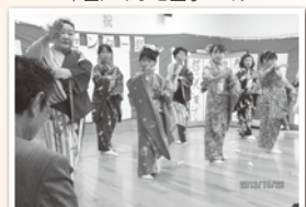
築川/センター祭り(踊り)