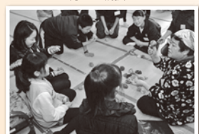
城南/昔遊び(お手玉)