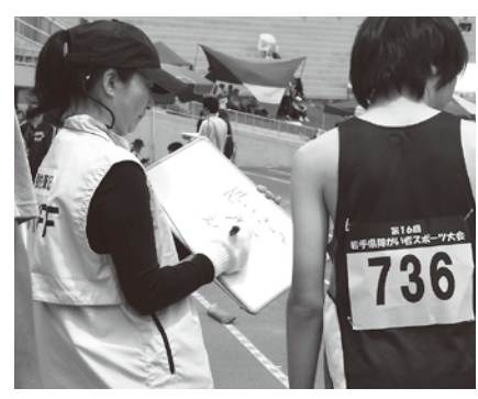
障がい者スポーツ大会ではアスリートたちをサポート

油性ペンで書いては消し書いては消し(布の手袋をしてその手袋で拭き消しながら)。会議などでは紙に書いてOHC(オーバーヘッドカメラ)でスクリーンに投射します。紙はロール状になっていて1画面ぶん書き終わるとアシストの人が紙を引っ張って次の言葉を書くようにしていきます。会議などではだいたい4人1組でOHCをとり囲んで座り、1人15分間ぐらいずつ交代しながら要約筆記します。次の順番の人は間違いを訂正したり脇から「補筆」するなど、アシストします。