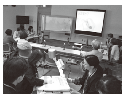
難聴の人たちの会議で4人1チームで活動

聞こえが不自由な人のために話し言葉を文字に書いて伝える「要約筆記」一話の内容をかいつまんで短い言葉に書き表すので「要約筆記」と呼ばれます。講座を所定時間受講し、試験をパスした人が「要約筆記者」としてこの活動をしています。現在、岩手県内で84人、盛岡市では18名が登録されています。