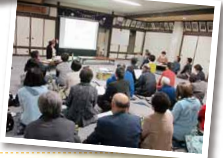
25年度事業からお茶っこサロン、災害救援ボランティアセンター地域福祉マップづくり