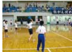
昨年の大会の様子

市内各小学校区の予選を勝ち抜いたドッジボールチームが集まり熱戦を繰り広げます。 日 時：平成26年7月27日(日) 場 所：盛岡市アイスアリーナ(本宮5-4-1) 主 催：盛岡市子ども会育成会連絡協議会