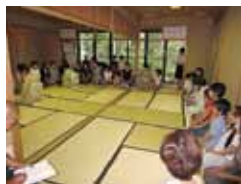
昨年の福祉茶会の様子

盛岡市にお住まいの70歳以上の方に割引券を配布します。 日 時：平成26年9月7日(日) 午後1時～ 場 所：杜陵老人福祉センター(南大通1-7-5) 申し込み：盛岡市社会福祉協議会(若園町2-2) (お1人様1枚まで) ※割引券を茶会会場にお持ちいただくと、通常900円のところを500円で入場できます。