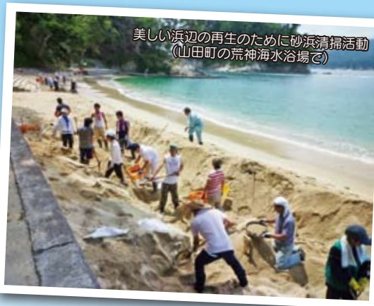
美しい浜辺の再生のために砂浜清掃活動 (山田町の荒神海水浴場で)