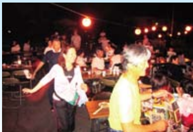
地元、川井地区の皆さんが夏祭りに招待してくれました