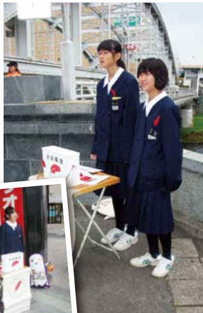
昨年の街頭募金の様子

今年も戸別募金、街頭募金、学校募金、職場募金などのご協力をよろしく申し上げます。