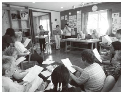
懐かしい曲に合わせて合唱(西見前のデイサービスセンターにて)

盛岡ハーモニカ同好会は、かつて上田公民館で行われたハーモニカ講習会を受講した人たちによって結成されました。皆さんそれまで未経験だった人たちなそうです。その後、地元放送局が開いたハーモニカ教室で練習を重ね、いまやアンサンブル演奏までこなす本格派のハーモニカ演奏グループです。