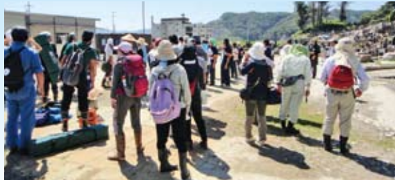
今年も全国から大勢のボランティアさんが参加しました