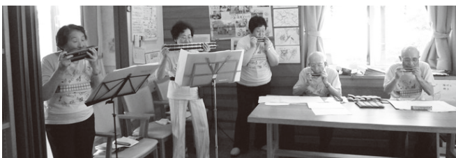
和音、低音用のハーモニカ(左手前)を使ってアンサンブルを聴かせてくれる

ある女性メンバーは「私はゼンソク気味だったんですが、ハーモニカを吹くといくと教えられてやっていたら、いつの間にかゼンソクがいなくなりました」と話していました。