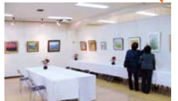
昨年の作品展の様子