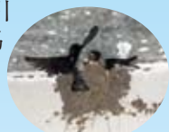
かわいキャンプ玄関上のツバメが巣立ちました