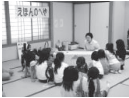
子どもたちは昔話も大好き