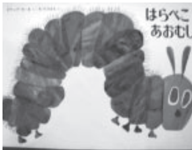
子どもたちの年齢に合わせ、季節感も考えながら絵本を選ぶ

転換に手遊びなどを入れる。創作ものだけでなく、昔話も聞かせる。これはメンバーの中に名人級の語り部がいて、オリジナルものから地元で伝わる昔話まで素話で聞かせてくれる。