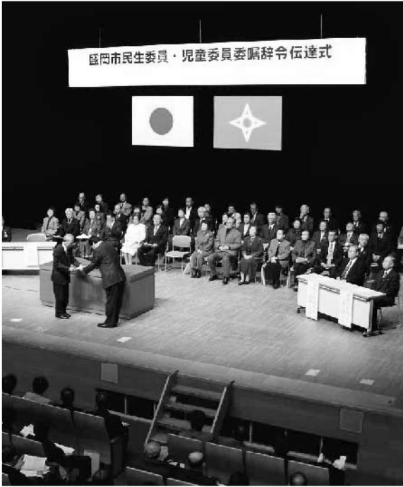
地区を代表して辞令を受け取る民生委員・児童委員

地域住民の相談を受けて、適切に行政機関や団体などにつなぎ、地域で安心して暮らすための活動を行う民生委員・児童委員の委嘱辞令伝達式が去る12月4日午後2時から盛岡市松尾町の盛岡劇場で開かれました。