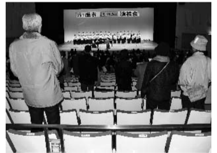
参加者も一緒に「千の風になって」を合唱