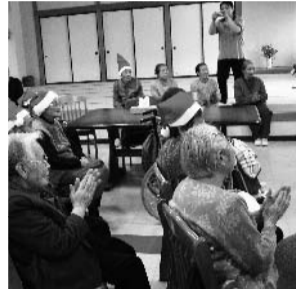
見る人の驚きの表情と歓声がうれしい

月2回（第2、4木曜日）、盛岡市総合福祉センターで例会をもち、新しいマジックを紹介し合ったり情報交換を行うほか、年2回程度プロのマジシャンを招いて研修会を行ったり、県内外で行われる発表会に参加して技術を磨く。その成果を毎年秋に「奇術の祭典」として発表、これが38回も続いている。また希望に応じて初心者対象のマジック指導会も開いている。