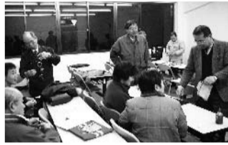
月例会で新しいワザを研究し合う