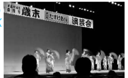
華やかなステージがくり広げられました