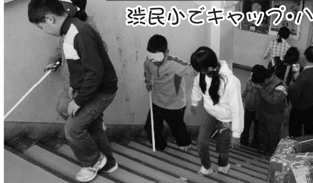
目隠し歩行の体験をする渋民小児童