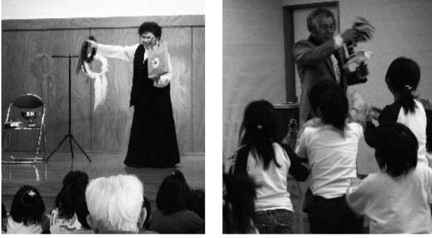
華やかなステージ