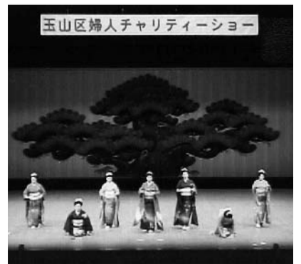
たくさんの踊りや歌が披露されました

このチャリティーショーは、福祉活動の一環として毎年12月に行われており、今回も社会福祉協議会を通じて歳末たすけあい運動に益金が寄付されています。