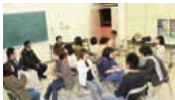
伝わっているかな？ 例会の様子