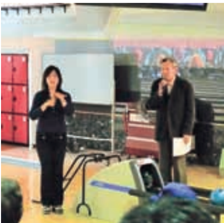
身障者ボウリング大会でのボランティア

例会：毎週水曜日、夜7時～9時 場所：盛岡市総合福祉センターボランティアルーム 問い合わせは盛岡市社会福祉協議会「地域福祉課」まで。 TEL (651) 1000