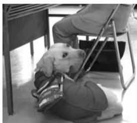
講師の足もとで待機する盲導犬ベル

講師として、盛岡市ボランティア連絡協議会、キャップハンディいわて、盛岡消費者友の会、地球環境共生ネットワーク岩手、手話サークルみず、岩手点訳の会、青山和敬荘、盲導犬のユーザーといった多彩な団体・個人の協力をいただき、参加した高校生からは、「さまざまな体験ができた」「講師の方々の貴重なお話しが聞けた」とたいへん充実したスクールになりました。