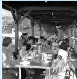
ウォーキングと焼肉大会

地域的に広いこともあり、玉山区と藪川地区に分けて同様の事業を実施することとしており、昨年度は、老人クラブや地区の児童館、地区公民館との協力で事業を行いました。 特に世代間交流会では児童館や学童クラブを会場に老人クラブの方々の参加をいただいて餅つきやそば打ち、昔遊び体験などの活動を行いました。 また、日戸地区のパークゴルフ場で親子でパークゴルフやウォーキングを楽しんだあとにバーベキュー大会を行い、参加者の皆さんに楽しんでいただきました。 昨年は一年目ということもあり、地域の皆さんに福祉推進会の組織や目的をお知らせしながらの活動でしたが、二年目の活動としては、世代を問わず多くの皆さんに参加していただけるような「ふれあい」の活動を目指して行きたいと思えます。