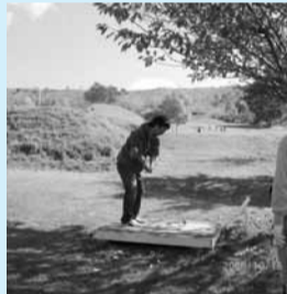
パークゴルフ大会