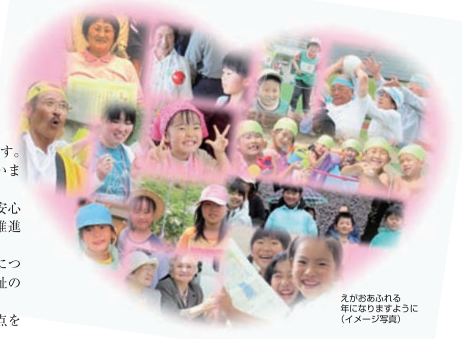
えがおあふれる年になりますように (イメージ写真)

本年も、皆様方の尚一層のご支援、ご協力をお願い申し上げ新年のご挨拶とさせていただきます。